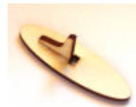
Ständer CLSH 4705

Zunächst wird die Schildertafel Herz (HEH16220), der Ständer für das Herz (CLSH4705), sowie der Geldscheinhalter (DAH0903-1) mit Acrylfarbe beidseitig grundiert.